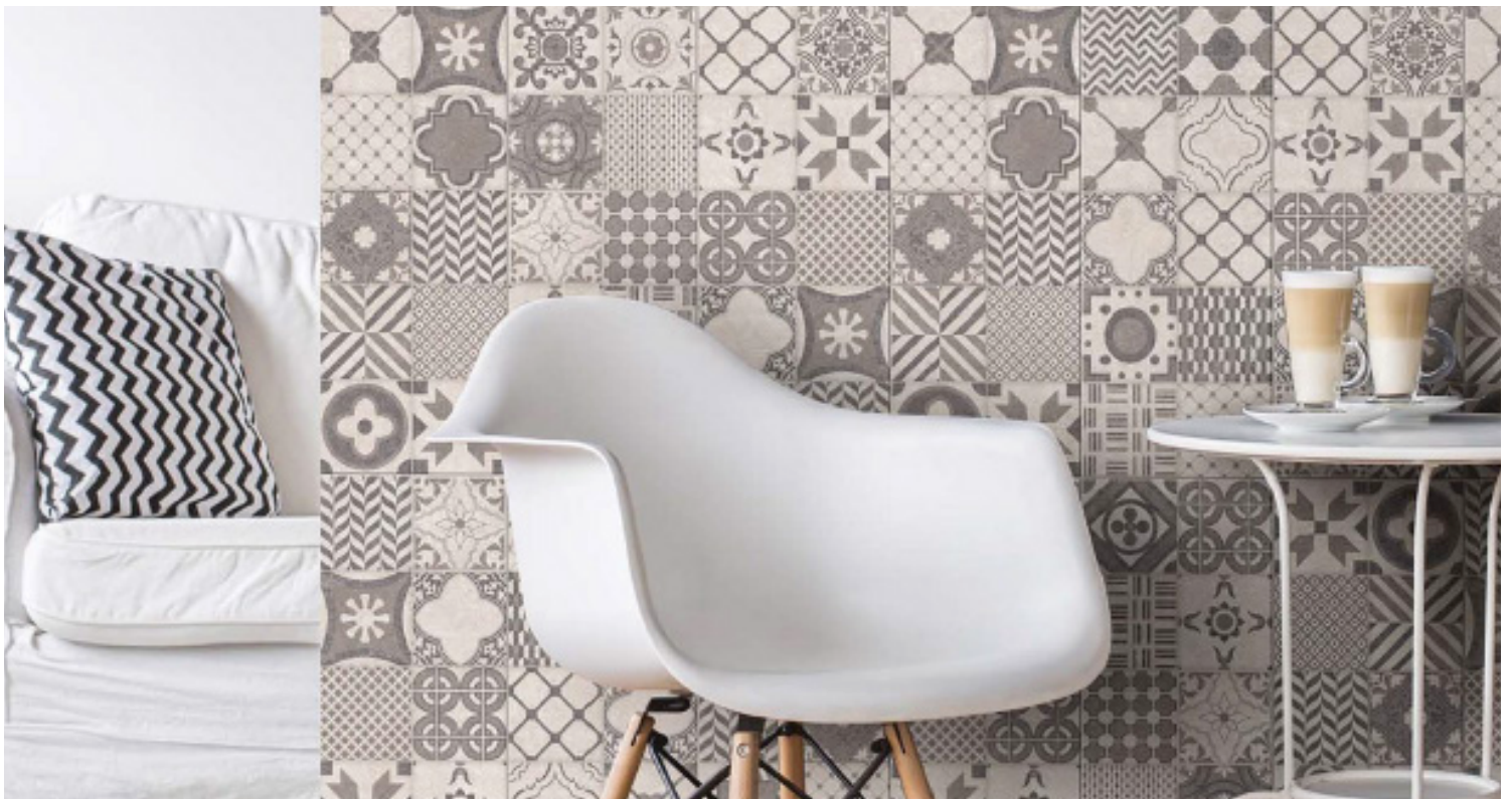
TAUPE 8" X 20" DÉCOR MAT