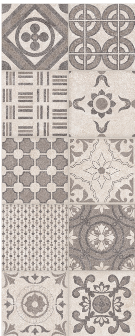
TAUPE DÉCOR "PATCHWORK" 20 x 50 cm (8" x 20") GE.GN.TPE.0820.MT.DC