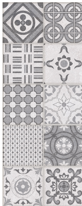
GRIS DÉCOR "PATCHWORK" 20 x 50 cm (8" x 20") GE.GN.GRY.0820.MT.DC

Tous les items présentés dans ce document font partie du programme d'inventaire Olympia. Pour les commandes spéciales, veuillez contacter votre représentant de Tuiles Olympia. Pour les commandes spéciales, veuillez contacter votre représentant de Tuiles Olympia.