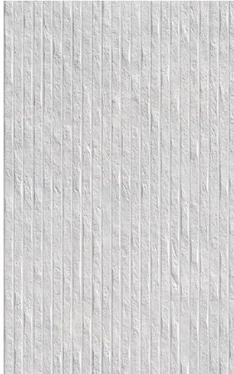
25 x 40 cm (10" x 16") Décor Brique en Relief GE.GN.LGR.1016.MT.DC