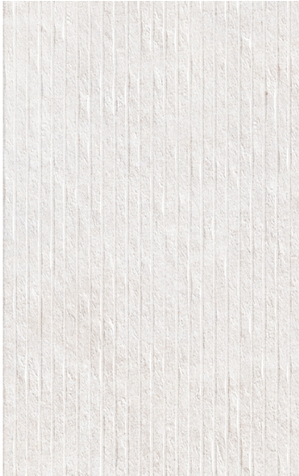
25 x 40 cm (10" x 16") Décor Brique en Relief GE.GN.WHT.1016.MT.DC