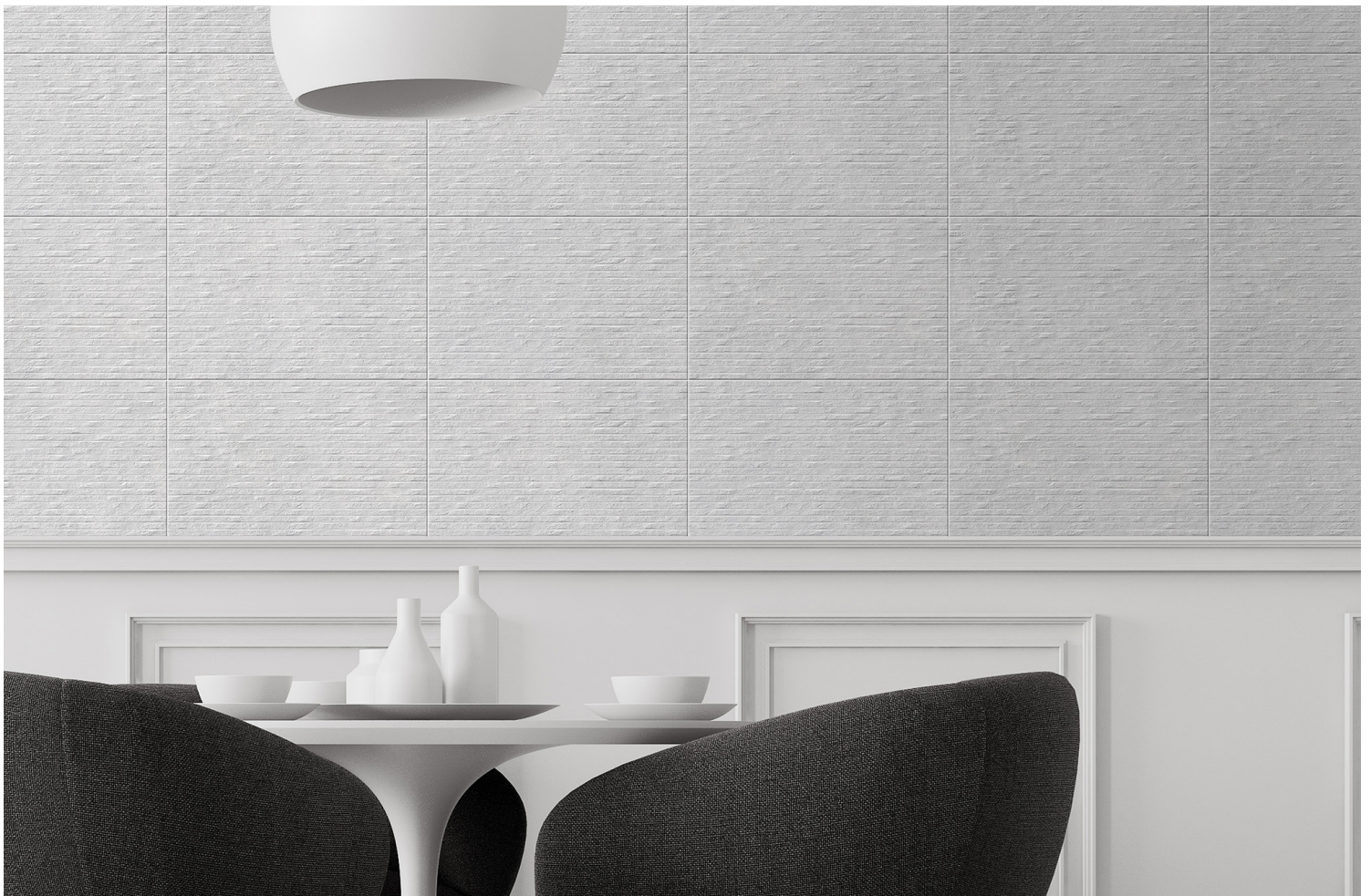
BLANC 10" X 16" DÉCOR MAT