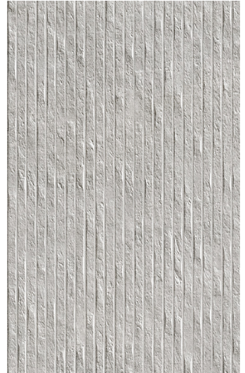
25 x 40 cm (10" x 16") Décor Brique en Relief GE.GN.GRY.1016.MT.DC