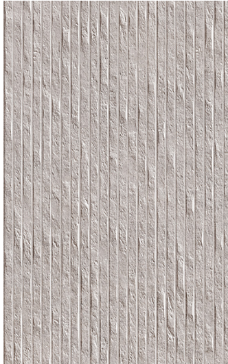
25 x 40 cm (10" x 16") Décor Brique en Relief GE.GN.TPE.1016.MT.DC